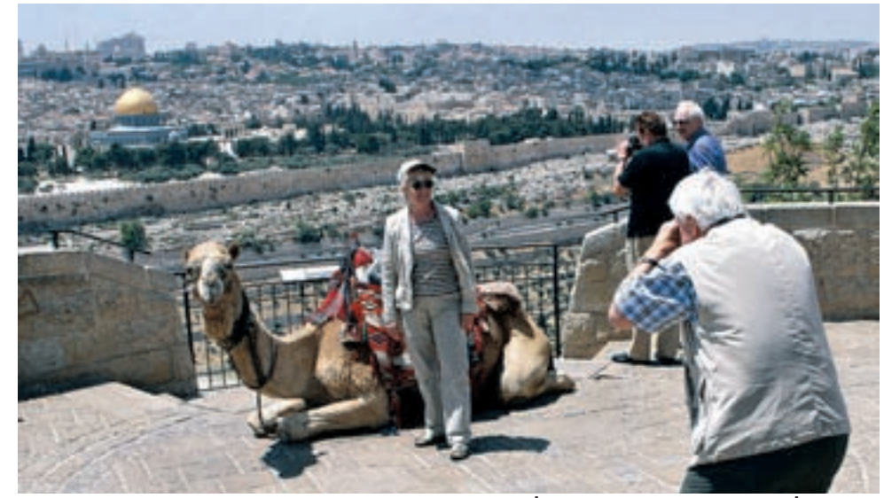
גן ירושלים מהר הזיתים. "העיר צריכה להיות שמרנית, שימורת ושומרת"

■ גבול לשמייים י"ש גבול לטיפוס לגובה בבניית מגדלים. הטענה שהו 'סביבת' בגלל הניצול היעיל של הקרקע והתשתיות, מתנגשת עם כמות האנרגיה העצומה שבניין כזה צורך. בקומה השמינית, כבר לא יפתחו חלון, שלא לדבר על הקומה ה־60, וזה אומר מיווג אוויר בריקו אימתני. צריך לננות לגובה, אבל אסור בשום פנים להגזים עם זה. מגדלים צריכים לתפוס פחות, הרבה פחות, מ־50% משטחה של עיר גדולה".