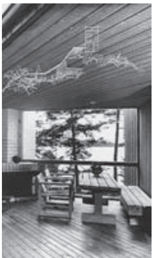
הבית בפינלנד. מהעצים שנגדעו

"משה" אנחנו גרים בשכונת ימין משה כבר 35 שנה. קנינו ב-1974. אני לא מתעניין ברווח שיכול היה לצמוח לי מהנכס