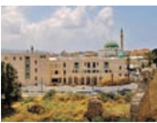
אכסניה בעכו. "עם השימור"

כשבאים תיירים להעריך ולהעריך את ירושלים ואת הגן הבהאי זה תורם לכלכלת העיר ולגאוות תושביה, אך נולדות סכנות שצריך להישמר מהן"