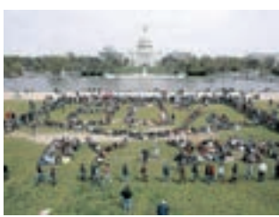
ושינגטון. "לגמד עם מגדלים"

בכל העולם, הנחלים זורמים אל הים. רק בארץ ישראל הים זורם לנחלים. אני עוד מחזיק בשלט שעליו כתוב באותיות מאירות עיניים "סכנה - ירקון!"