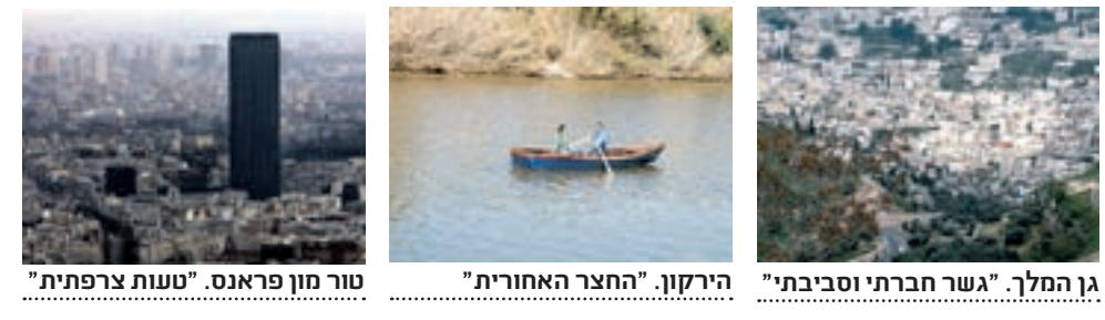
גן המלך. "גשר חברתי וסביבתי" הירקון. "החצר האחורית" טור מון פראנס. "טענות צרפתית"

■ גבול לשמייים י"ש גבול לטיפוס לגובה בבניית מגדלים. הטענה שהו 'סביבת' בגלל הניצול היעיל של הקרקע והתשתיות, מתנגשת עם כמות האנרגיה העצומה שבניין כזה צורך. בקומה השמינית, כבר לא יפתחו חלון, שלא לדבר על הקומה ה־60, וזה אומר מיווג אוויר בריקו אימתני. צריך לננות לגובה, אבל אסור בשום פנים להגזים עם זה. מגדלים צריכים לתפוס פחות, הרבה פחות, מ־50% משטחה של עיר גדולה".