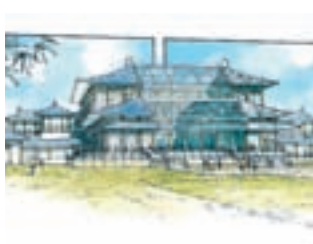
שחזור ארמון שושלת טנג

הבון טון הוא אדריכלות 'ירוקה' וגם מקובל שזה מין עניין חדש בעולמנו. זה משעשע. הגישה שלבנייה יש זיקה לאקלים ימיה כימי האדריכלות"